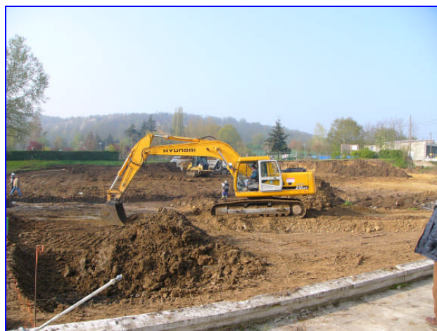
Début du chantier : 20 avril 2005