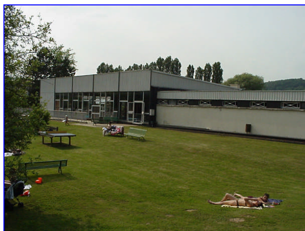
Avant travaux : juillet 2004